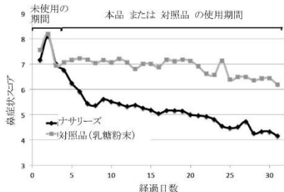
図 1: 鼻症状合計スコアの変化(1 日あたりの平均値の経時的推移)